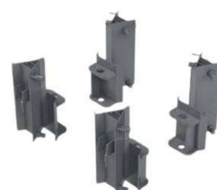
CONJUNTOS MÓVEIS 250kg 62,5KG (CADA)