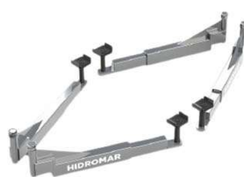
BRAÇOS 100kg 50KG (CADA)