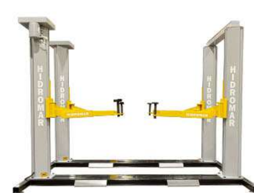
SUPER CARGO 5.5 1.700kg TOTAL