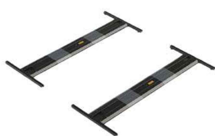
BASE 550kg 275KG (CADA)