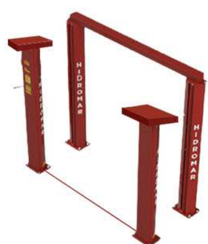
COLUNAS 800kg TOTAL